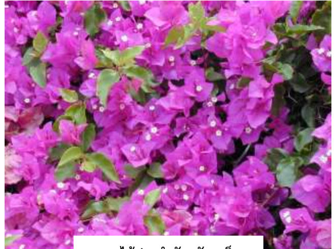
ดอกไม้ประจำจังหวัดภูเก็ต ดอกเฟื่องฟ้า